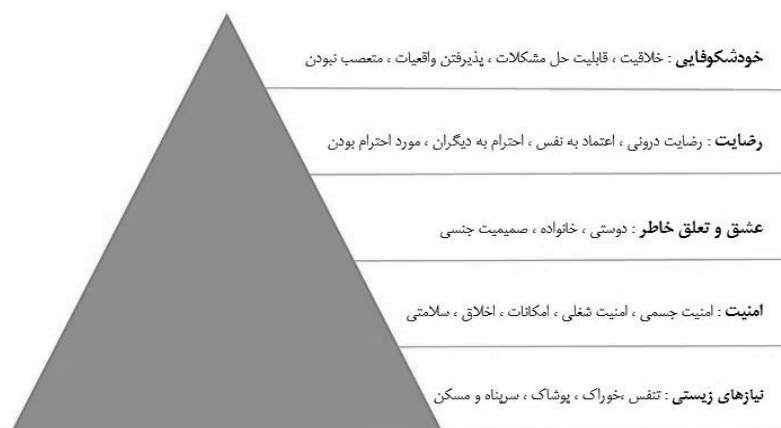
شکل ۱ - هرم نیازهای انسانی آبراهام مازلو